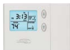
ComfortSense™ Série 3000