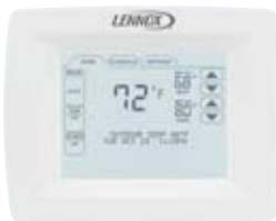
ComfortSense™ Série 7000