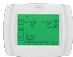
ComfortSense™ Série 5000